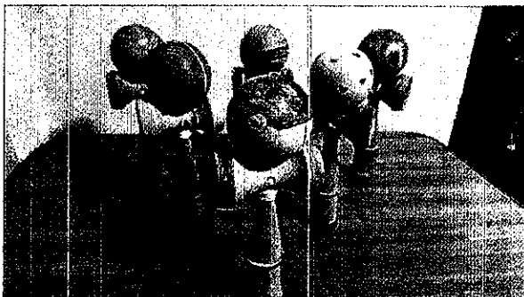
冬休み けん玉づくり